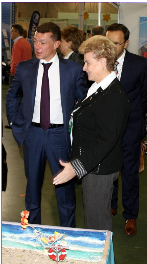
Глава Республики Крым, Председатель Совета министров Аксенов С.В.:

- «Впечатлен. Поражен. И тем отношением коллектива к людям, которые попали в трудную жизненную ситуацию. И самими людьми, которые сегодня учатся, получают образование, получают специальную профессиональную подготовку, получают шанс на вторую жизнь».